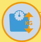
體重突然上升或下降